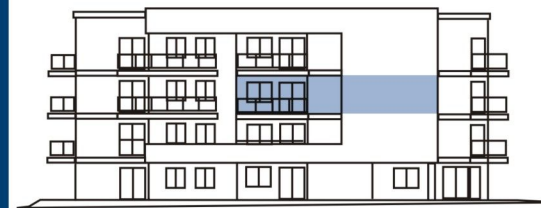
Elewacja południowo - wschodnia