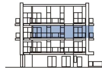
Elewacja północno - wschodnia